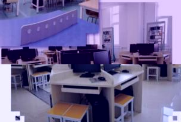
一体化课程教学设计综合实训室