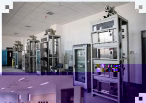
智能电梯安装调试维护训练场所